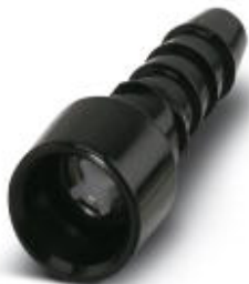
Conector hembra para neumática con válvula, para módulo HC-M-PN3, diámetro interior de tubo flexible 4,0 mm

Tenga en cuenta que los datos indicados aquí proceden del catálogo en línea. Los datos completos se encuentran en la documentación del usuario. Son válidas las condiciones generales de uso de las descargas por Internet. ( http://phoenixcontact.es/download )