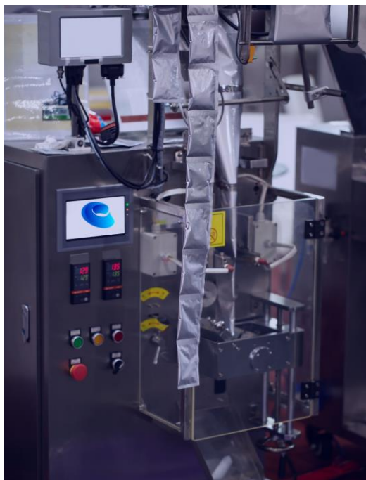
Caso de éxito "Llenadora de sachets para shampoo" (clic aquí)